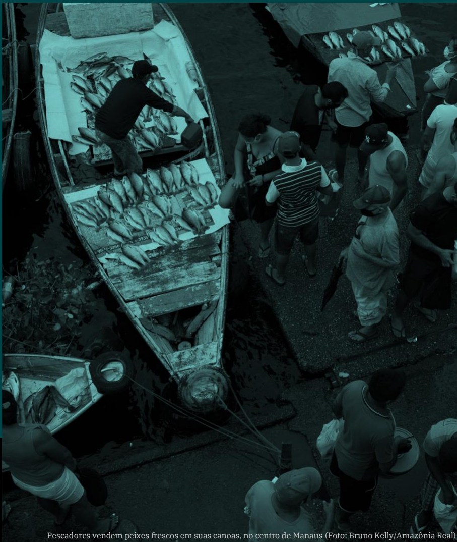
Pescadores vendem peixes frescos em suas canoas, no centro de Manaus

Causas e impactos das mudanças nos ecossistemas aquáticos